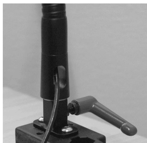
Ledning ført inde i flexarm.