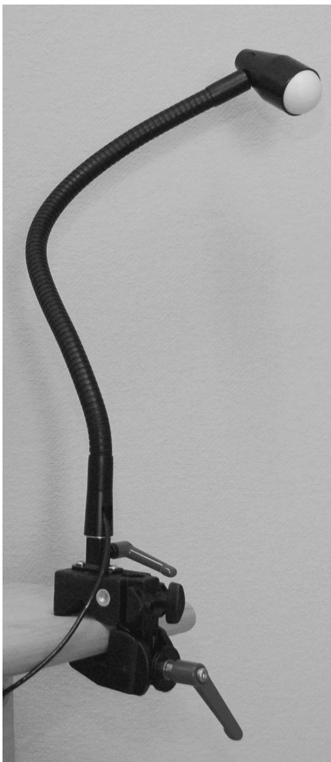
Flexarm på Superclamp, indvendig kabel kontakt monteret i 90°

Flexarm med kindkontakt er udviklet til brugere med ALS, CP samt rygmarvsskadede.