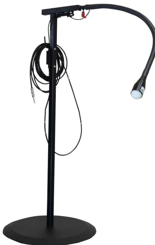
Flexarm med kontakt på gulvstativ med kabel, kontakt monteret i 0°